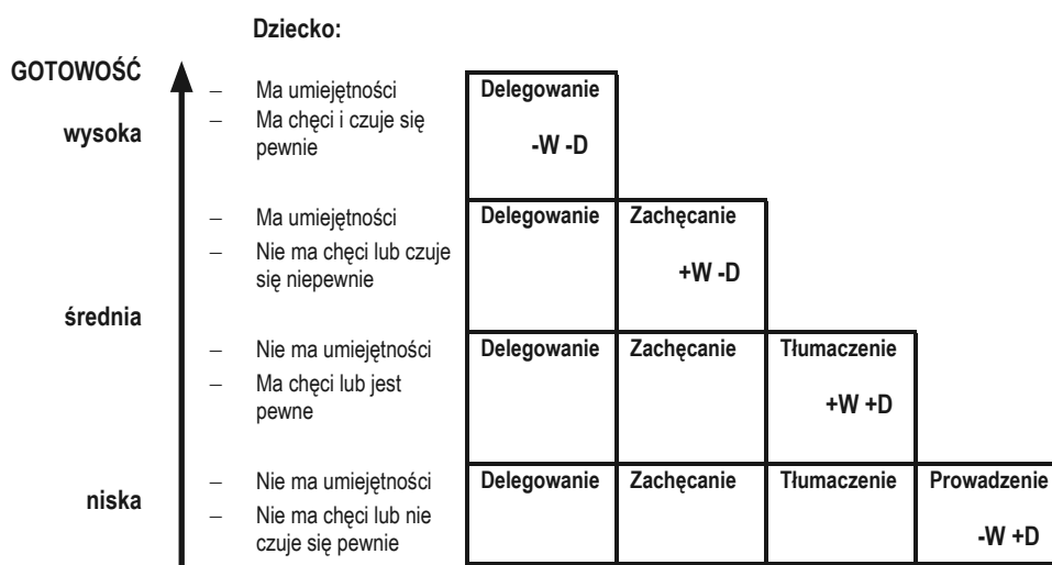
Rycina 2. Dopasowanie stylów wychowawczych do gotowości dziecka do działania w ujęciu Herseya i Campbella

Należy jeszcze raz podkreślić, że według teorii Herseya i Campbella style wychowawcze nie są stałymi cechami zachowywania się rodziców wobec dzieci, ale są dynamiczne, zmienne w zależności od okoliczności – czyli cech sytuacji/zadania i postrzeganych przez rodziców kompetencji/umiejętności i motywacji dziecka. W różnych sytuacjach i w różnym wieku dziecko potrzebuje mniej lub więcej emocjonalnego wsparcia, potrzebuje być mniej lub bardziej kierowane w swoich działaniach.